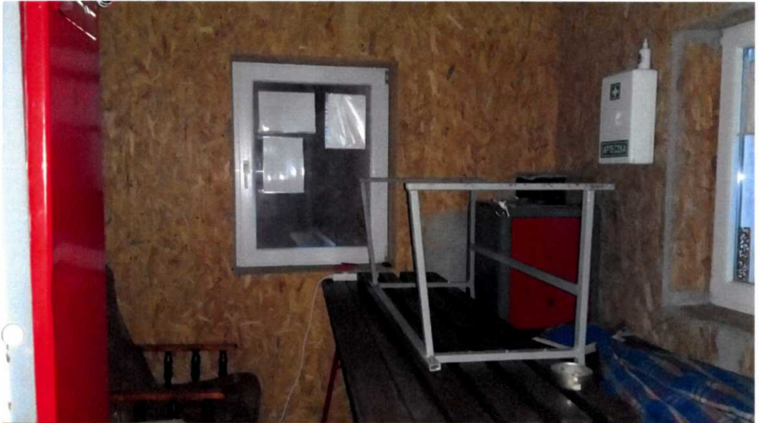
Zdjęcia sugerowanego pomieszczenia do modernizacji