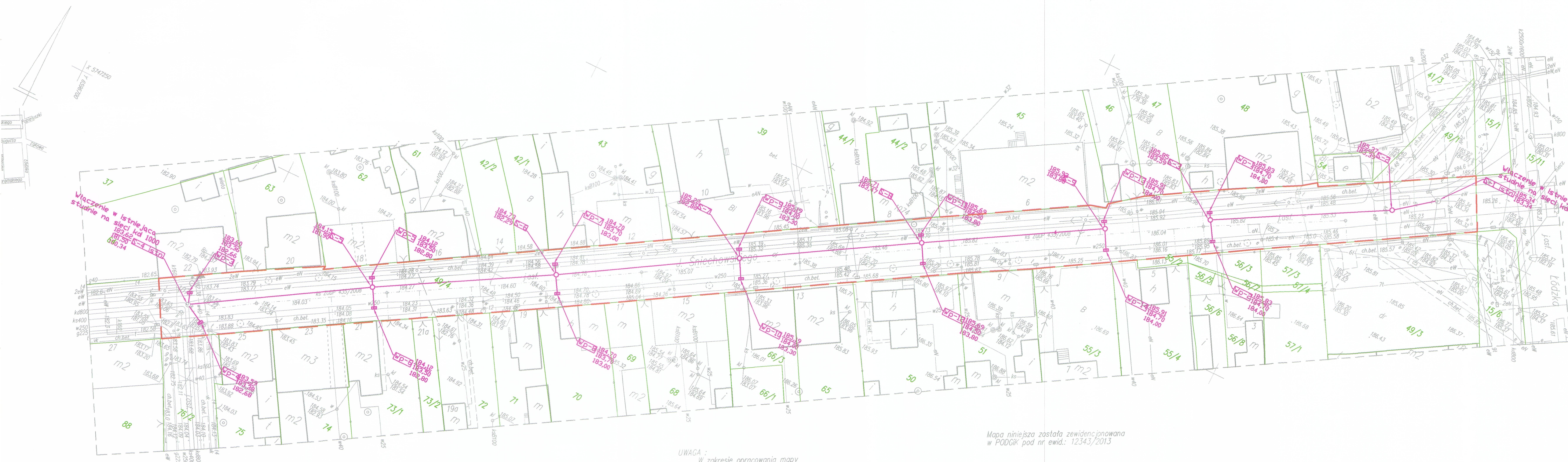
Plan sytuacyjny skala 1:500