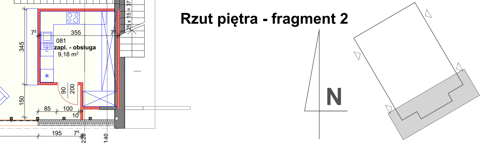
Rzut piętra - fragment 2